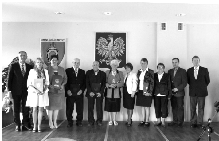
Pamiątkowa fotografia po dekoracji odznaką "Zasłużony dla Gminy Wielgomłyny"