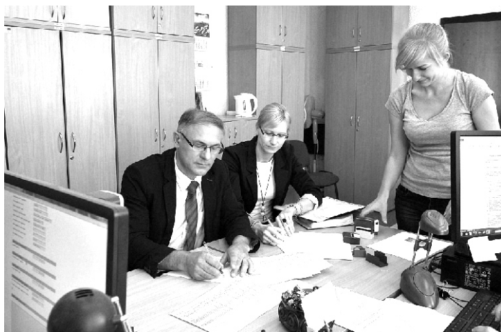
Moment podpisania umowy

Inwestycja już jest realizowana i w przypadku dobrej pogody będzie zakończona na koniec października 2014 roku. Wodociąg liczył będzie około 3.850 metrów i zbudowany zostanie z nowoczesnych materiałów. Głównym wykonawcą jest firma WOD-KOP Artura Fiszera.