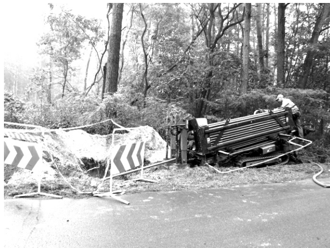
Prace przy układaniu rur przewiertem kontrolowanym