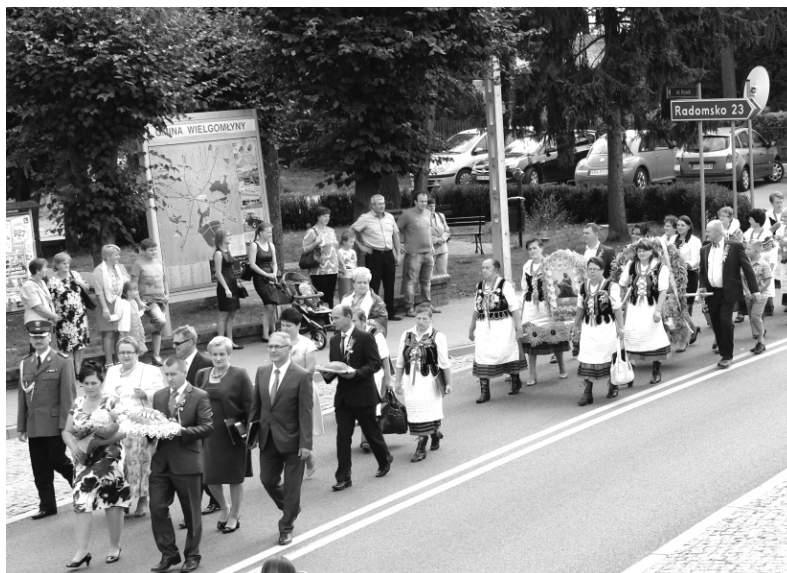
W Wielgomłyńskim Rynku