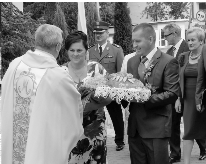
Przywitanie starostów i korowodu dożynkowego przez o. Proboszcza